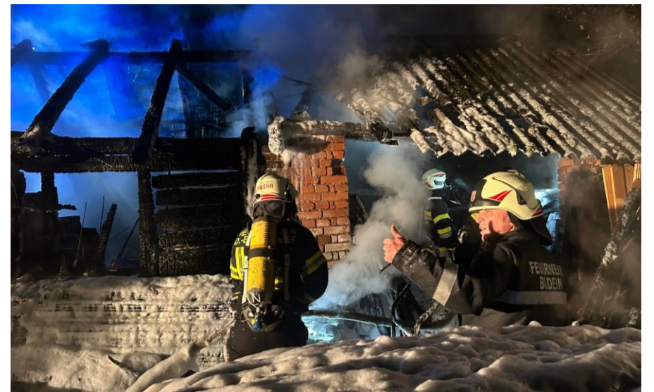
Insgesamt standen acht Feuerwehren mit 17 Fahrzeugen und rund 100 Einsatzkräften im Einsatz. Auch das Rote Kreuz sowie die Polizei waren vor Ort.

Kurz vor 23:00 Uhr wurde am 10. März 2026 in Winten die höchste Alarmstufe ausgelöst. Unsere Feuerwehr wurde gemeinsam mit sieben weiteren Wehren zu einem Brandeinsatz alarmiert. Ein Nebengebäude in unmittelbarer Nähe zu einem Wohnhaus stand aus bislang unbekannter Ursache in Vollbrand. Durch die enorme Hitzentwicklung gerieten zudem zwei, zwischen den beiden Gebäuden abgestellte, Pkw in Brand. Innerhalb weniger Minuten rückten wir mit beiden Einsatzfahrzeugen zum Einsatzort aus. Durch das rasche und koordinierte Eingreifen aller eingesetzten Kräfte konnte ein Übergreifen der Flammen auf das Wohnhaus sowie die umliegende Vegetation verhindert werden.