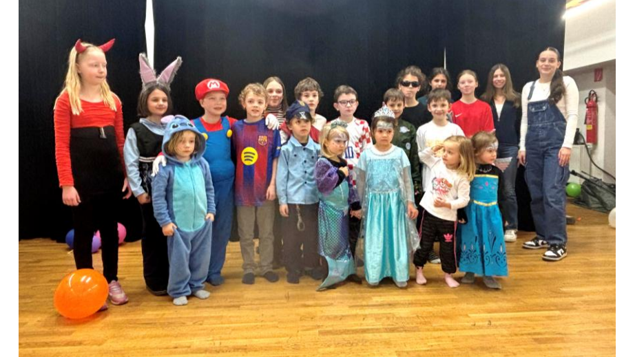
Ein herzliches Dankeschön an alle Sponsoren.

Ein riesiges DANKE an alle kleinen und großen Besucher*innen, die mit uns den Fasching so gemütlich und fröhlich ausklingen ließen! Wir freuen uns jetzt schon aufs nächste Jahr!