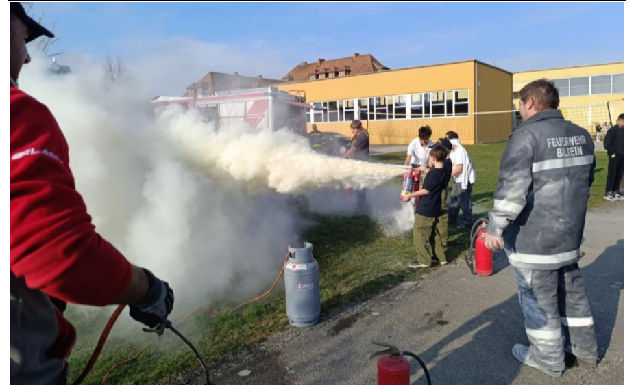
Die Schülerinnen durften selbst, unter Anleitung unserer Kameraden und Feuerwehrjugendmitgliedern, verschiedene Feuerlöscher - Pulver, Schaum und Wasser - zum Löschen einsetzen. Auch das HD-Rohr des Tanklöschfahrzeuges konnten sie ausprobieren.

Die Nachmittagseinheit von "Feuerwehr macht Schule" am 11. März 2026 organisierte unsere Feuerwehr. Zuerst gab es im Physik- und Chemieunterricht der 4. Klasse der MS Josefinum eine Theorieeinheit zur Feuer- und Löschlehre. Im Rahmen der Nachmittagsbetreuung wurde mit den Schüler*innen der Volks- und Mittelschule das Verbrennungsdreieck und die Löschwirkungen wiederholt, bevor wir mit ihnen gemeinsam das Wissen in die Praxis umgesetzt haben. Besonders beeindruckend für die Kinder war das Experiment "Ölbrand". Dabei zeigten wir die Reaktion, wenn man brennendes Öl mit Wasser löscht und welche Alternativen sicher sind.